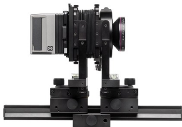
サードパーティ製アダプターにより ビューカメラでも使用可能

ハッセルブラッドCFデジタルバック・シリーズは、プロフェッショナル・デジタル・フォトグラファーに新次元の柔軟性を提供します。2200万画素または3900万画素センサーを選べるほか、画像の保存方法も、携帯性に優れたCFカード、超高速保存が可能な100GBイメージバンク、多彩な制御が可能なコンピュータ接続の3種類から選べます。また、オープン・カメラ・インターフェースであるi-アダプターを使用すれば、CFシリーズをさまざまなカメラで使用できますので、お好みのカメラでハッセルブラッドの撮影クオリティが発揮できます。さらにCFデジタルバック・シリーズでは、補間なしにデジタル画像を撮影するマルチショット撮影が可能な機種があるほか、ハッセルブラッド・スター・イメージ・クオリティも実現可能ですので、デジタル撮影の世界が大きく広がります。