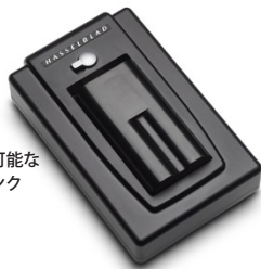
超高速大量保存が可能な 100GBイメージバンク

CF デジタルバックでは、携帯性に優れた CF カード、超高速大量保存が可能な 100GB イメージバンク、多彩な制御が可能なコンピュータ接続の 3 種類から記録方法を自由にお選びいただけますので、必要に応じて柔軟な対応が可能となります。